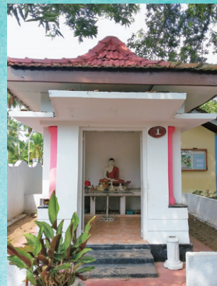
学校敷地内の仏堂