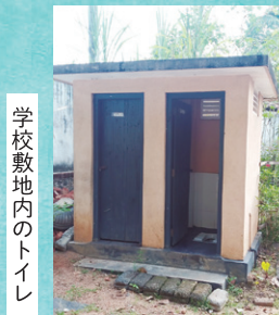
学校敷地内のトイレ