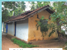
剥落の目立つ壁面